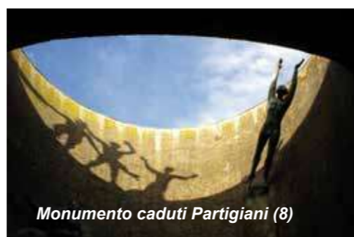
Monumento caduti Partigiani (8)

Il cimitero fu inaugurato con l'intenzione di farne il luogo dove esaltare il contributo dei cittadini rispetto alle glorie dinastiche e familiari. In tale direzione è la costruzione nel 1828 del Pantheon dei bolognesi illustri , ora spazio adibito a Sala del Commiato o per altre funzioni religiose, integrato nel 2008 con l'allestimento dell'artista Flavio Favelli.