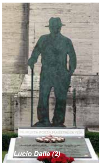
Lucio Dalla (2)